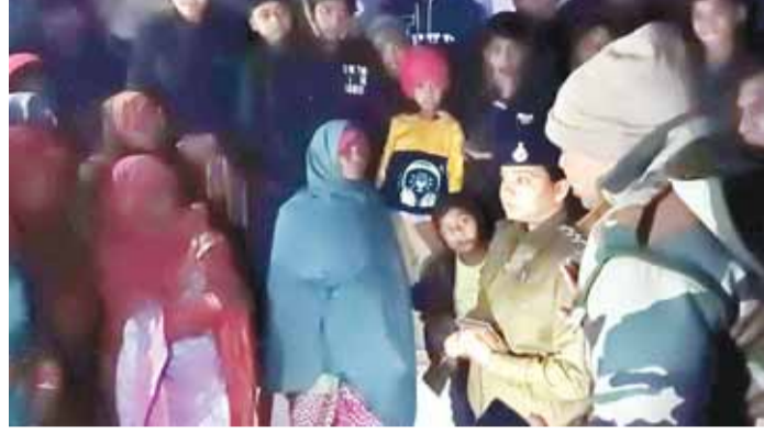
कार्यालय पहुंच गई।

गौरतलब है कि ग्राम देवरी मवई में अवैध शराब का कारोबार फल-फूल रहा था। शिकायत के बावजूद भी स्लीमनाबाद पुलिस के द्वारा पैकारियों को बंद नहीं कराया जा रहा था जिसके बाद गाँव से अवैध शराब को बंद करने नारी शक्ति ने आवाज बुलंद की। मंगलवार को ग्राम देवरी मवई की नारी शक्ति ने पैकारी में धावा बोला एवं वहाँ से शराब लेकर एसपी